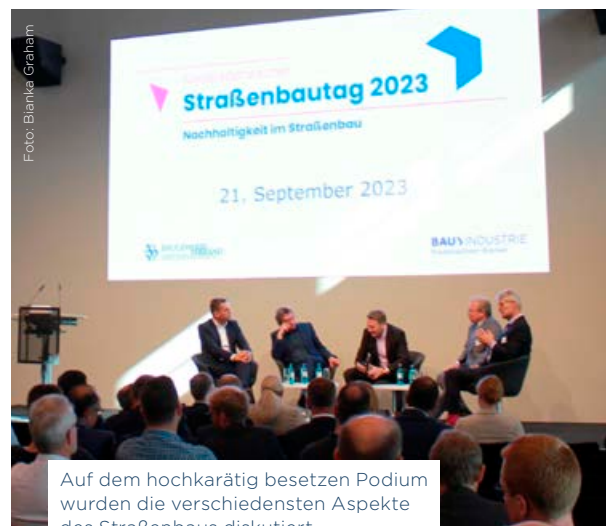
Auf dem hochkarätig besetzten Podium wurden die verschiedensten Aspekte des Straßenbaus diskutiert.

Beim Niedersächsischen Straßenbautag in Osnabrück, veranstaltet von der Landesfachgruppe Straßen- und Tiefbau zusammen mit dem Bauindustrieverband Niedersachsen-Bremen e. V., stand diesmal das Thema „Nachhaltigkeit im Straßenbau“ im Fokus. Bei der Auftaktveranstaltung im „Coppentrath-Innovations-Center“ begrüßten Christian Staub, Präsident des Baugewerbe-Verbandes Niedersachsen und Jens Peter Zuther, Obermeister der Straßenbauer-Innung Osnabrück-Emsland, die zahlreichen Gäste aus Handwerk und Industrie. Anschließend informierte der niedersächsische Wirtschaftsminister Olaf Lies in einem kurzweiligen Vortrag über die „Infrastruktur für die Verkehrswende“. Neben einer hochkarätig besetzten Podiumsdiskussion, befasste sich eine Reihe weiterer Programmpunkte mit den verschiedenen Aspekten der Nachhaltigkeit im Straßenbau. Insgesamt zeigte der Straßenbautag auf, dass das Thema Nachhaltigkeit vom Baugewerbe nicht nur als Herausforderung, sondern auch als Chance verstanden wird. Deshalb setzt sich der Straßenbau für die Entwicklung nachhaltiger Lösungen ein, welche die Umweltauswirkungen von Bauprojekten minimieren.